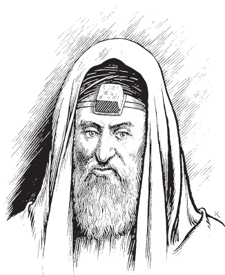
Farisii tia gben há jugu

3 L`ba na n`valgm ka hɛna bii ban bɔɓɔ bii hɛn. Lee, daa hɛm-n wo ban hɛna lee! Bà kpaɓ hɛna bii ban weraa bii hɛn. 4 Bà boowa wanjeet ka tula nidba, ka kpaɓ tia na bà tarm bà nabiir mɔmr wantii hɛn, na bá tɔrg-ba na bá bee bà toɓɓ-t. 5 Bà hɛna bà