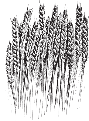
Kpoonu moot bia

«*Sangbambiimn huraant tōna gumsarbiir nida nn buud dii. 32 Ban buud-d d`ba kaaga lee, d`berɲ n kit tibermb n yat jivaat tiitii mentii. Dn kita tibermb lee, gwεenii t ka kena ka hēna hí sohga b`huliitn.»