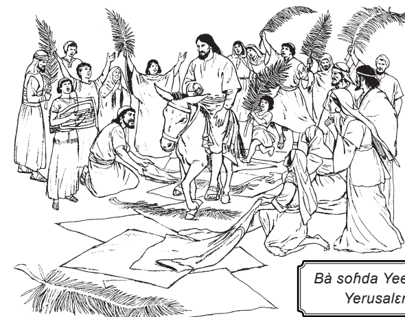
21.3 Berma bagl-hi, laa hí tia bagl-hi. Hà ba hà hëmæg-hi yelmaa. 21.9 Hoosaanaa kotod nnii na bá nyokm Sangband! Gwætii ba Yum118 an .25-26.

«Ked-n korgu kú baa lafii n`nongan kuun! Nn ba n`taai kan yelmaa lee, n`ba n`nyaan boñniiga bahr kan, ká n`kà buga, n`bahdg-ka n`daan n`man, ká n`kà bugee. 3 Ka hii t`gbaam-n lii, n`leedg-wu na berma bagl-hi. Ka n`leedg welee, bà si-n huru yelmaa n`daan n`hin 2 .» 4 L`da hëra welee na gwæet weem daa *gwæet bôhoo-ba nn da bed tii he t`noor hèn. Tii nnii na: 5 Biir-n *Siyoon korgu na: Geedg! V`huraa kena v`man, ka ba bulaa, ka kad boñña hèn, da boñhergan. 6 Gwæet sohdgtba t ta san welee, n hëm bii hian bed na bá he bii, 7 n daan n boñniigee n kà bugee, n doom bá dimt hí hèn, há juul n kad. 8 Nidba kodgu t ka yada bá dimt hurun. Volba badra tiit vaara ka ta doola hù hèn. 9 Nidba bá da deñr Yeesua nongan n bá da kena n hà kaann bee, bà da toola na: «Hoosaanaa! Bá nyokm *Daviida yakiiga! Sangband kaawlm hii hà kena wii hèn! Hà kena d`hidrn. Bá nyokm Sangband sangbambiimn 2 !»