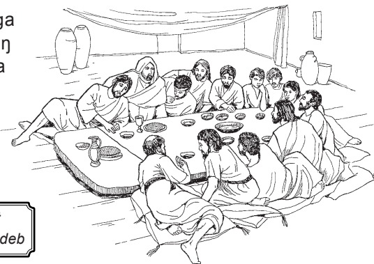
Yeesuwu n hà gwæet sohdgtba heewra n diit deb

«Jah-n kpowdgankena n`nyii-ka ka tõe taa n`