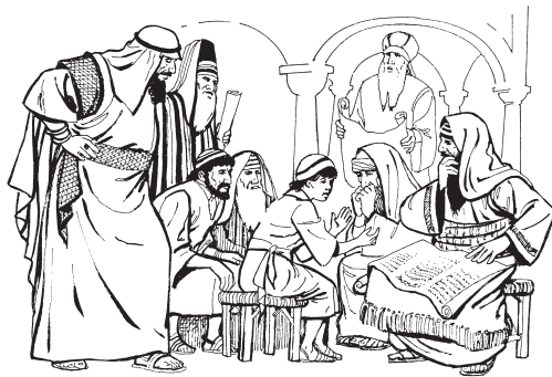
Yeesuwu n bafib weriitba Sangband haarn

43 Kasant nn da difi lee, bá ηmæt ka kulaa. Yeesu lee, wii t kpat *Yerusalem korgun, h̄a reba kpa mi. 44 Bà da diila na h̄a ba bà tuurmba bá n bà l' da kulaa bee man. Bá h̄em gobilmr ka ked safn n hiw n ka bag-wu bá reba n bà tuurmba man. 45 Gwentaha, bà ba nyaan-wu. Lee wen, bá ηmetgii Yerusalem korgun ka bag-wu. 46 Gotafrd goor bá yum-wu *Sangband haarn. H̄a da kada *bafib weriitba huuga ka