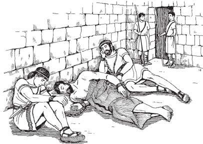
Fetra ba sargan ka go

18 Tonju nn dan n ragd lee, tawdba t ka yɔhwa ka gbaama taa na